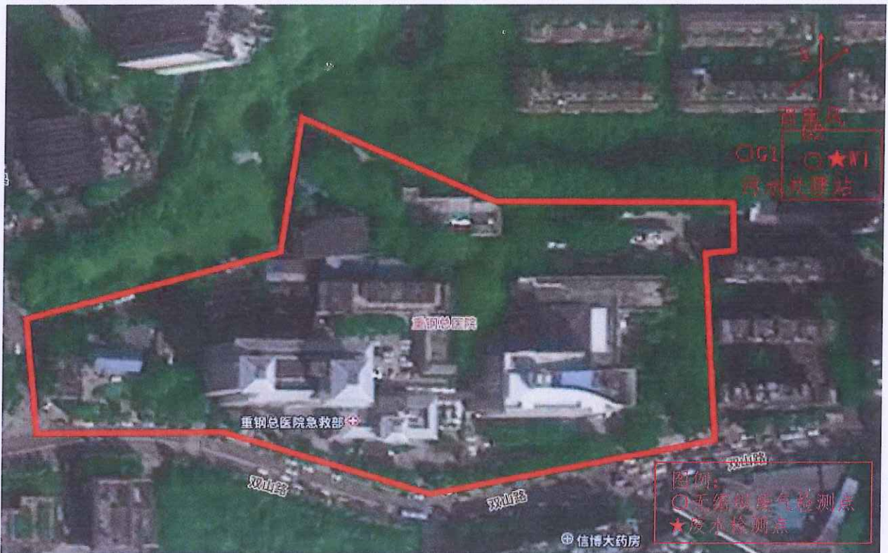
图一 无组织废气、废水检测示意图